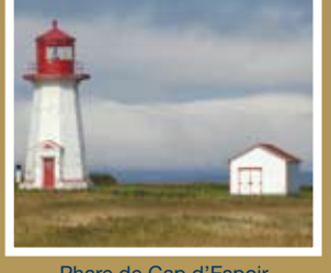
Phare de Cap d'Espoir