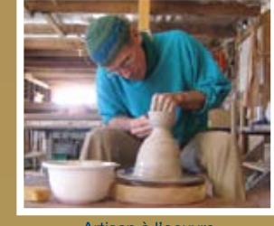
Artisan à l'oeuvre

Plage (non surveillée) Cueillette d'agates et de jaspes Phare (sans visite intérieure) Agrotourisme