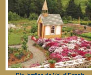
Bio-jardins de Val-d'Espoir